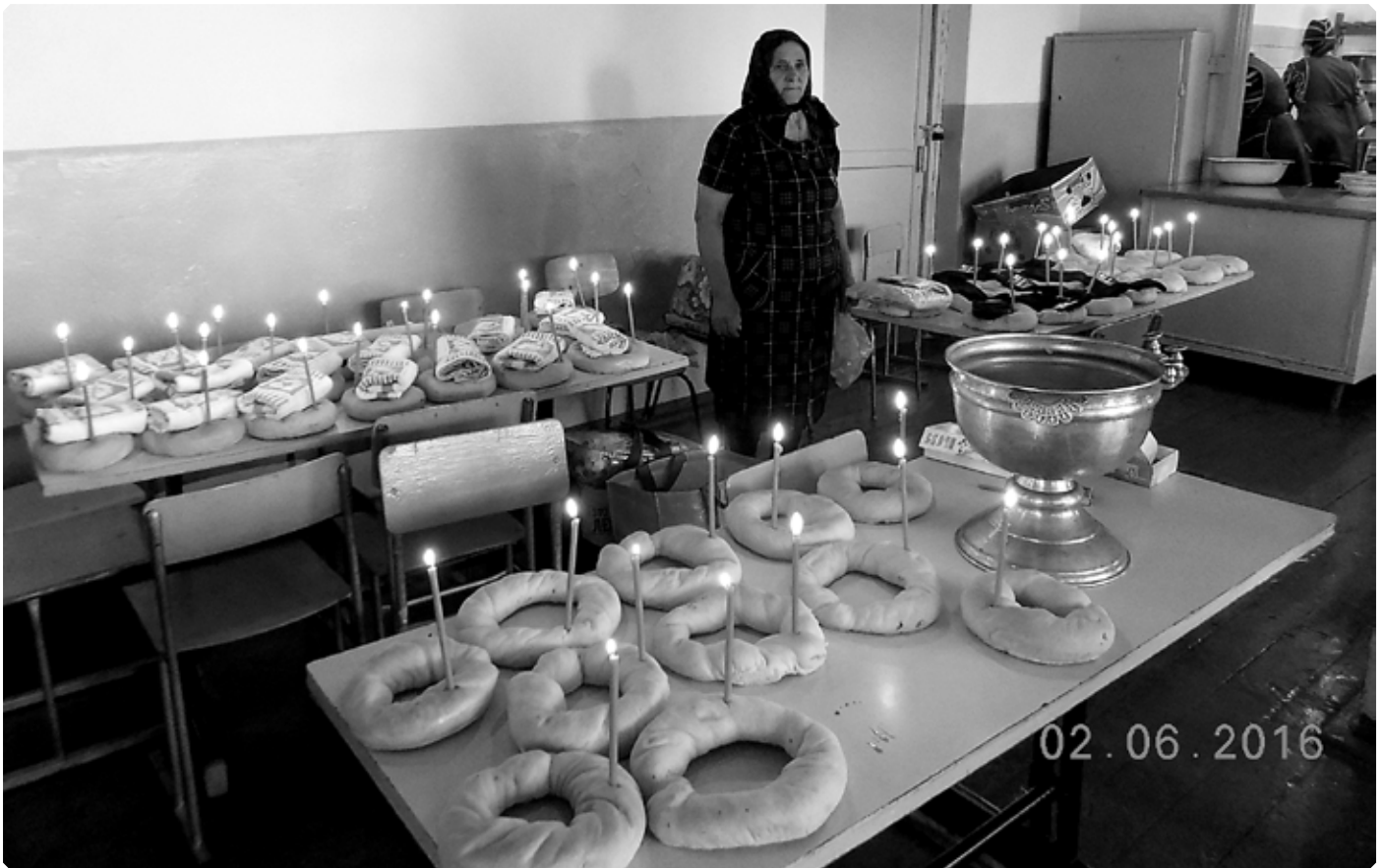
Подготовка к панихиде по Савве Руссу. с. Верх-Ануйское. 2 июня 2016 г.