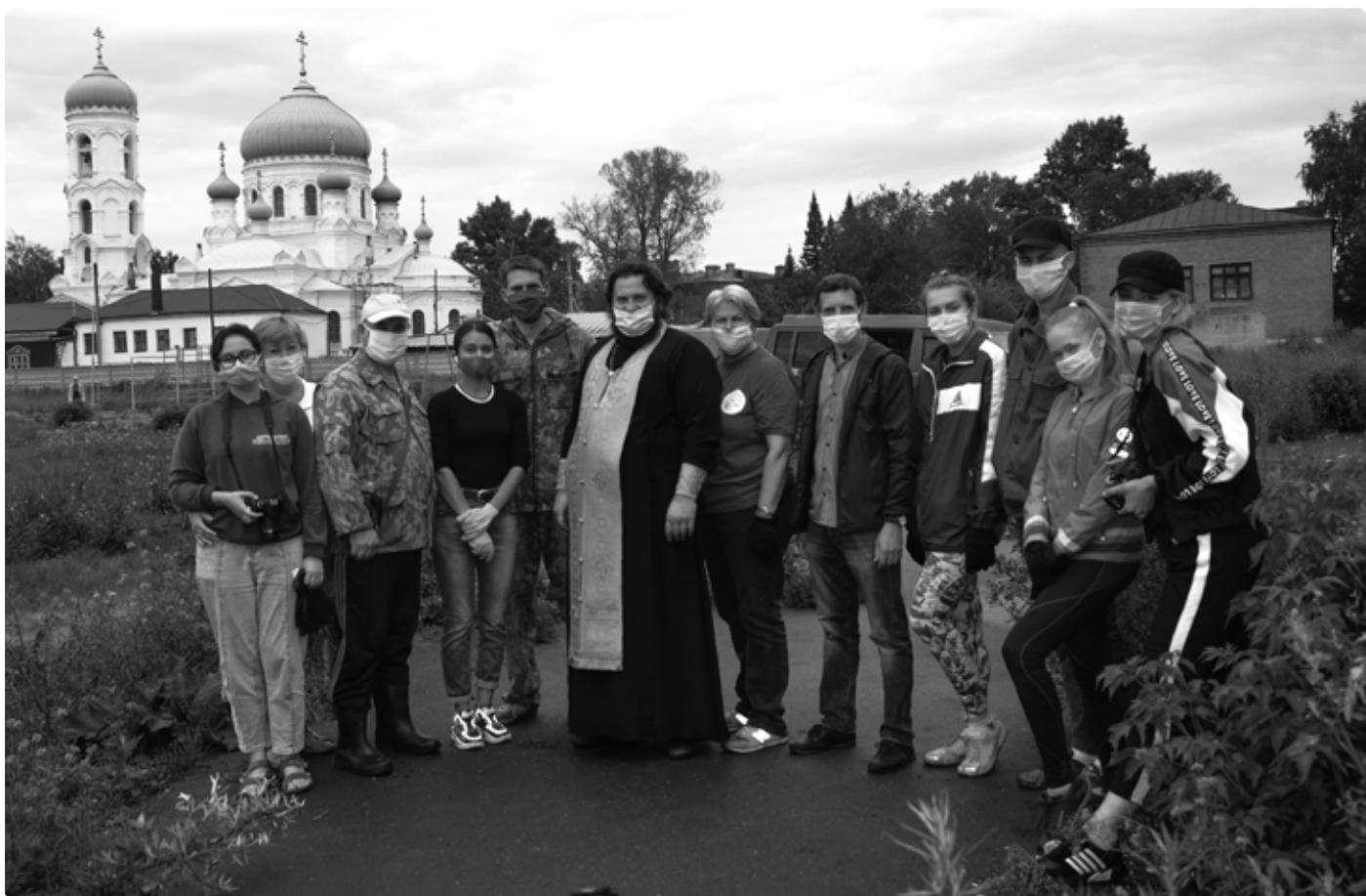
Общее фото участников благотворительной акции на территории бывшего стадиона «Авангард». 28 июля 2020 г.