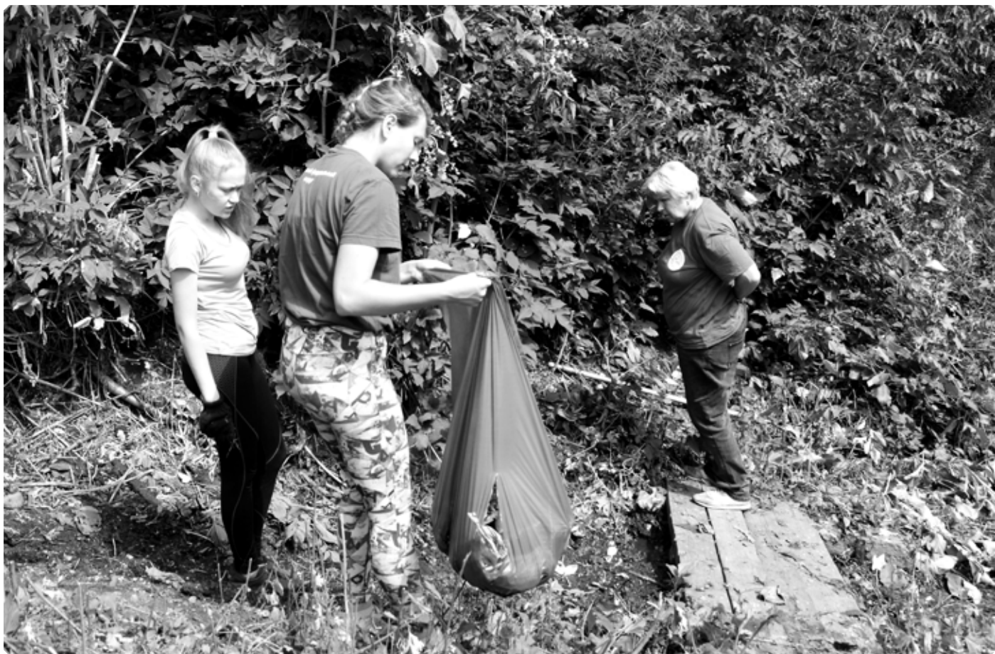
Участники экспедиции Алтайского государственного педагогического университета за работой. 28 июля 2020 г.