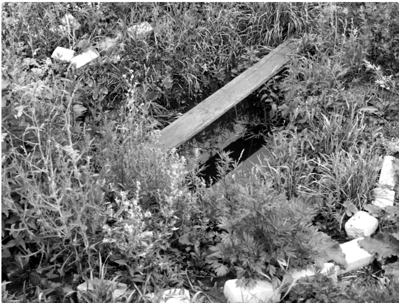
Родник рядом с Успенским кафедральным собором (фото сделано до выполнения работ по благоустройству источника)

На слиянии Бии и Катунь, у истока Оби стоит белокаменный храм святого благоверного князя Александра Невского, а на берегу реки есть святой источник. Он хорошо обустроен, и нередко здесь можно встретить людей, приходящих за целебной водой.