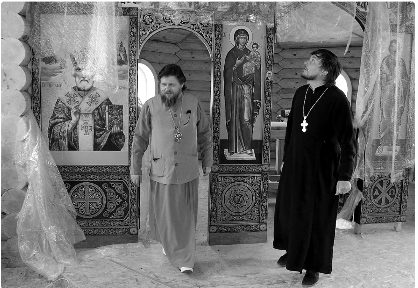
Архиерей и настоятель в строящемся храме. с. Верх-Ануйское. 20 мая 2020 г.