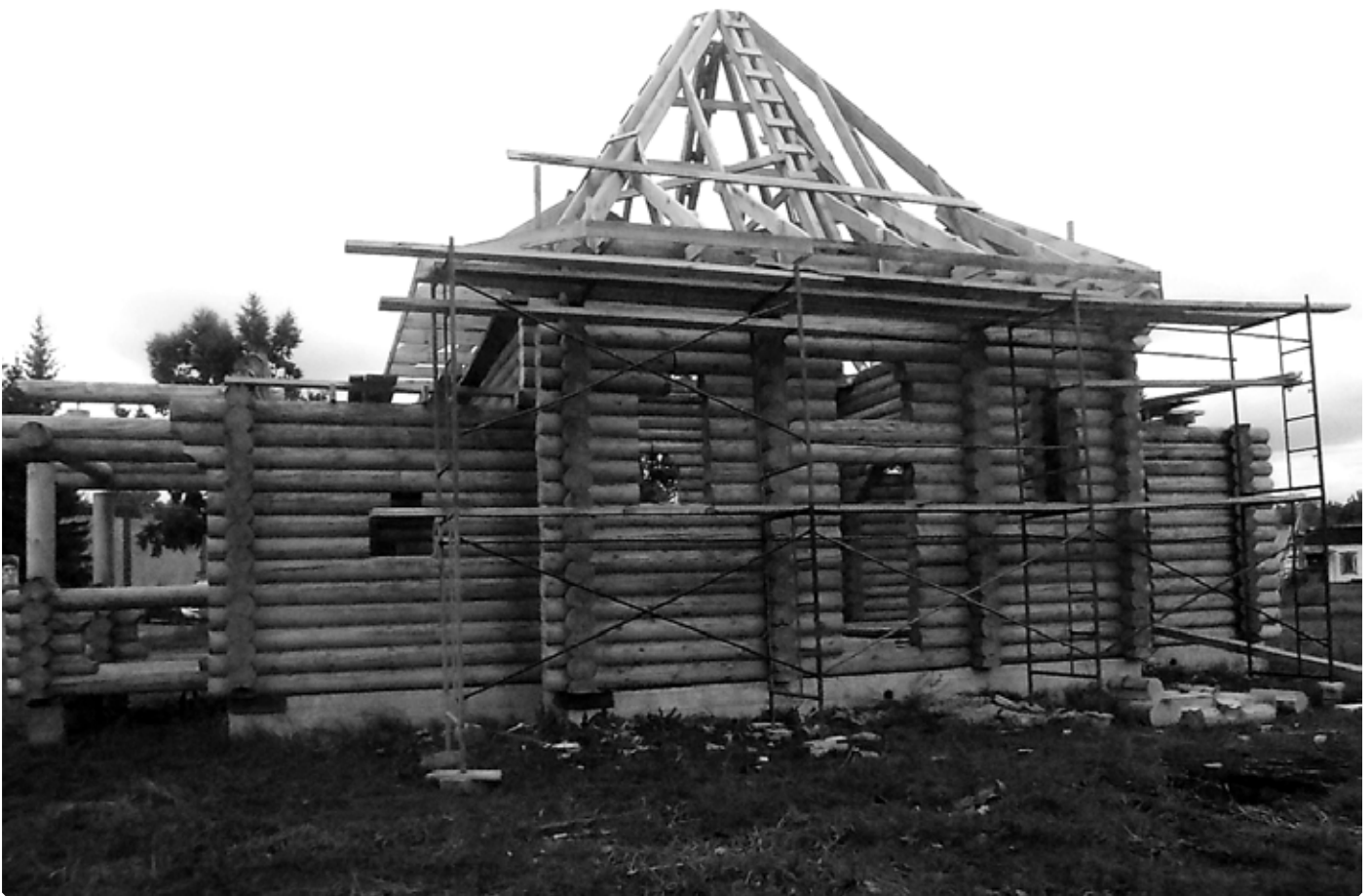
Строительство храма. с. Верх-Ануйское. 4 сентября 2018 г.