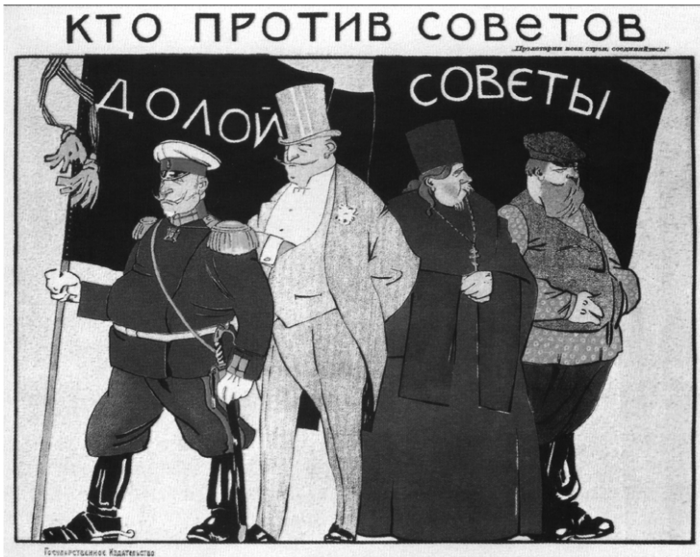
Агитационный плакат времен Гражданской войны «Кто против Советов». Д. Моор. Государственное издательство. 1919 год