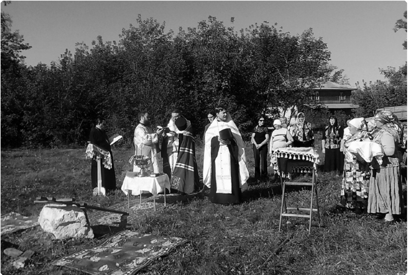
Освящение закладного камня в основание храма Живоначальной Троицы. с. Верх-Ануйское. 8 сентября 2016 г.