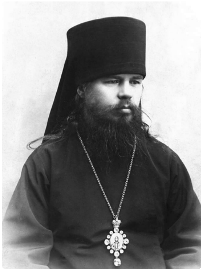
Преосвященный Мелетий (Заборовский), епископ Барнаульский, викарий Томской епархии. Начало XX века

«ПРИРОДА И НАСЕЛЕНИЕ АЛТАЯ. ...Во всех местах Алтая, где есть “чернотравье” или “большетравье“, – так называют алтайские крестьяне растительность горных долин в отличие от низкорослой травы степей – более или менее распространено пчеловодство. Эта отрасль сельской промышленности особенно развита в пределах Бийского округа. Пчеловодство на Алтае большей частью пасечное. Пасеки устраиваются вдали от селений, обыкновенно в поперечных долинах или логах, отличающихся глубиной, часто в очень живописных местностях, около журчащей речки, течение которой скрывается в глухой чащи из берез, черемухи, бузины, гороховника и других кустарников, любимых пчелами. ...Алтайский мед, благодаря своему тонкому аромату, славится повсюду, он является важным продуктом для домашнего употребления и для торговли. На Алтае мед составляет одно из самых любимых лакомств тамошнего населения. Его употребляют в пищу как чистым, так и во всевозможных смесях: мед с маком, малина с медом, медовое варенье...»