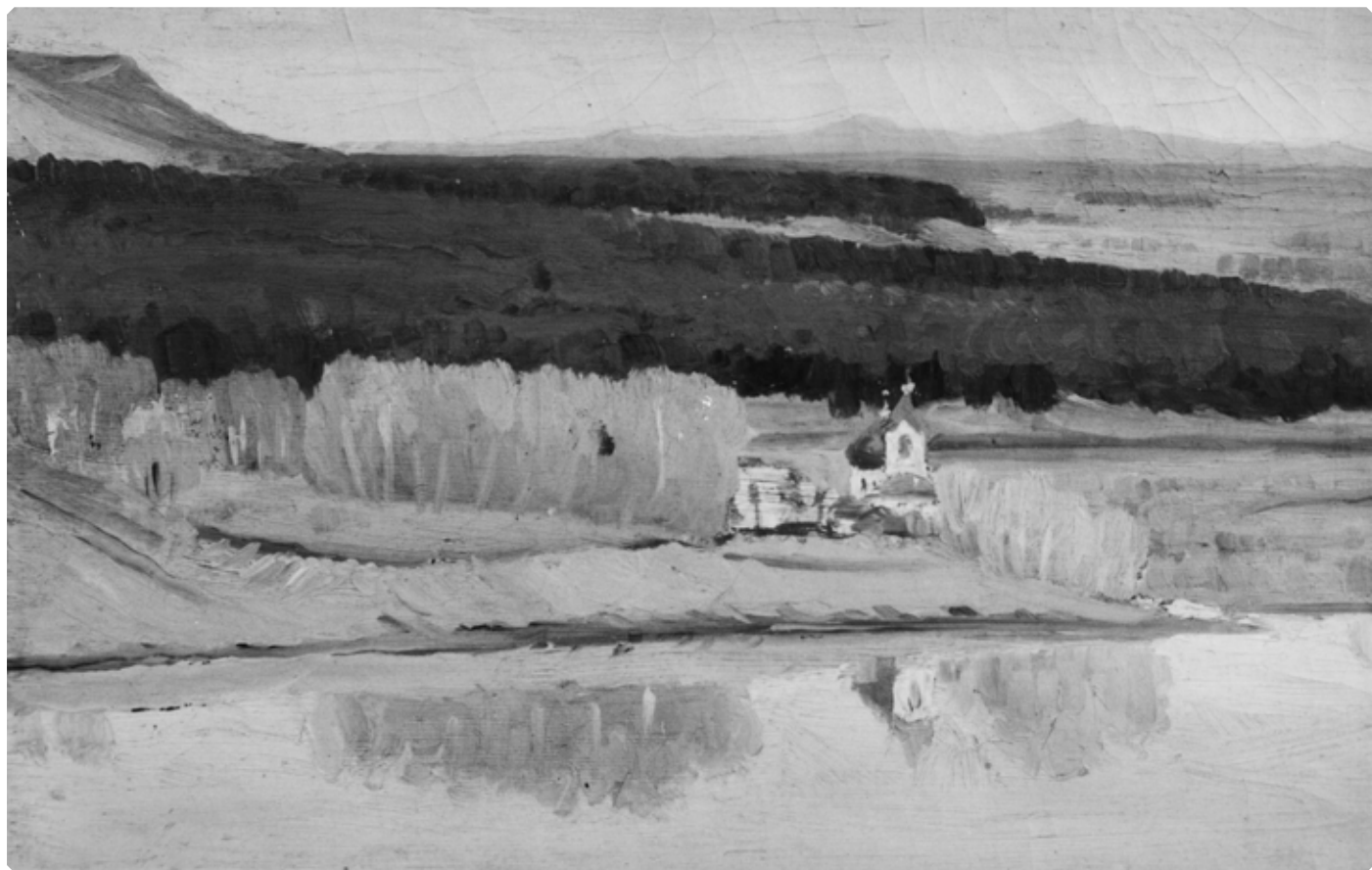
Д.И. Кузнецов. В окрестностях Бийска. Тихвинский женский монастырь. 1907 г. БКМ