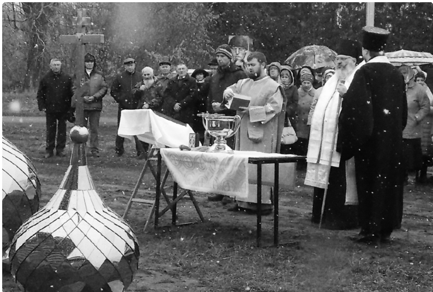
Освящение куполов и крестов храма Живоначальной Троицы. с. Верх-Ануйское. 20 октября 2018 г.

наружной и внутренней отделки и подготовку Троицкого храма к освящению. Впереди электромонтажные работы, установка системы отопления, после которых можно будет стелить чистовой пол. Немало предстоит сделать и снаружи: проконопатить стены, отшлифовать бревна, пропитать их антисептиком, покрасить. Необходимо утеплить фундамент и залить отмостку, привести в порядок прилегающую территорию. Работы, требующей значительных финансовых и трудовых затрат, еще очень много. Лето завершается, и, значит, до холодов нужно успеть запустить отопление, чтобы не потерять долгие зимние месяцы для внутренних работ.