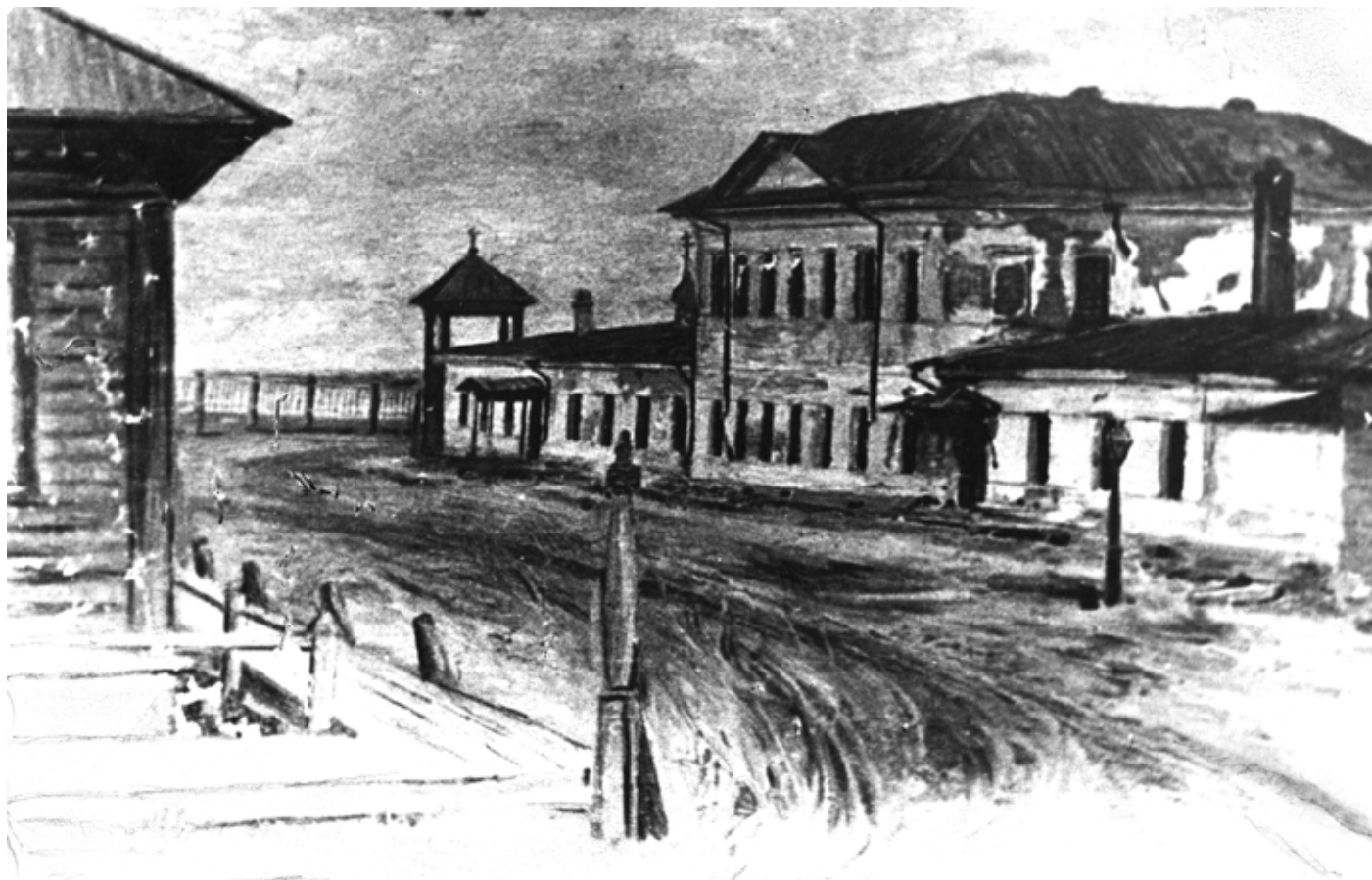
Архиерейский дом и катехизаторское училище. Рисунок Г.И. Гуркина. Конец XIX в. Копия. БКМ

священный дар, благословение г. Казани Алтаю, стал возможен благодаря трудам владыки Палладия и настоятельницы монастыря.